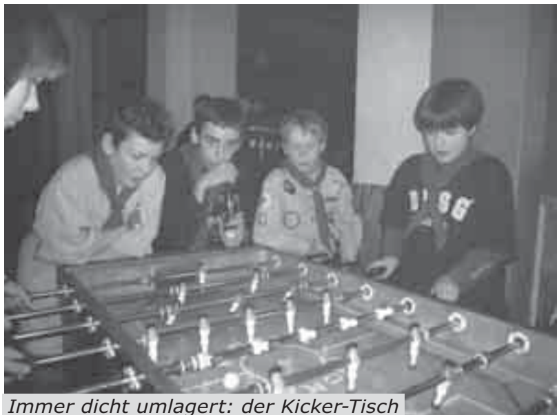
Immer dicht umlagert: der Kicker-Tisch

Endlich einmal ein ganzes Wochenende mit dem Juffitrupp im Gruppenraum verbrachten die Mädchen und Jungen vom Aachener Stamm Sankt Adalbert.