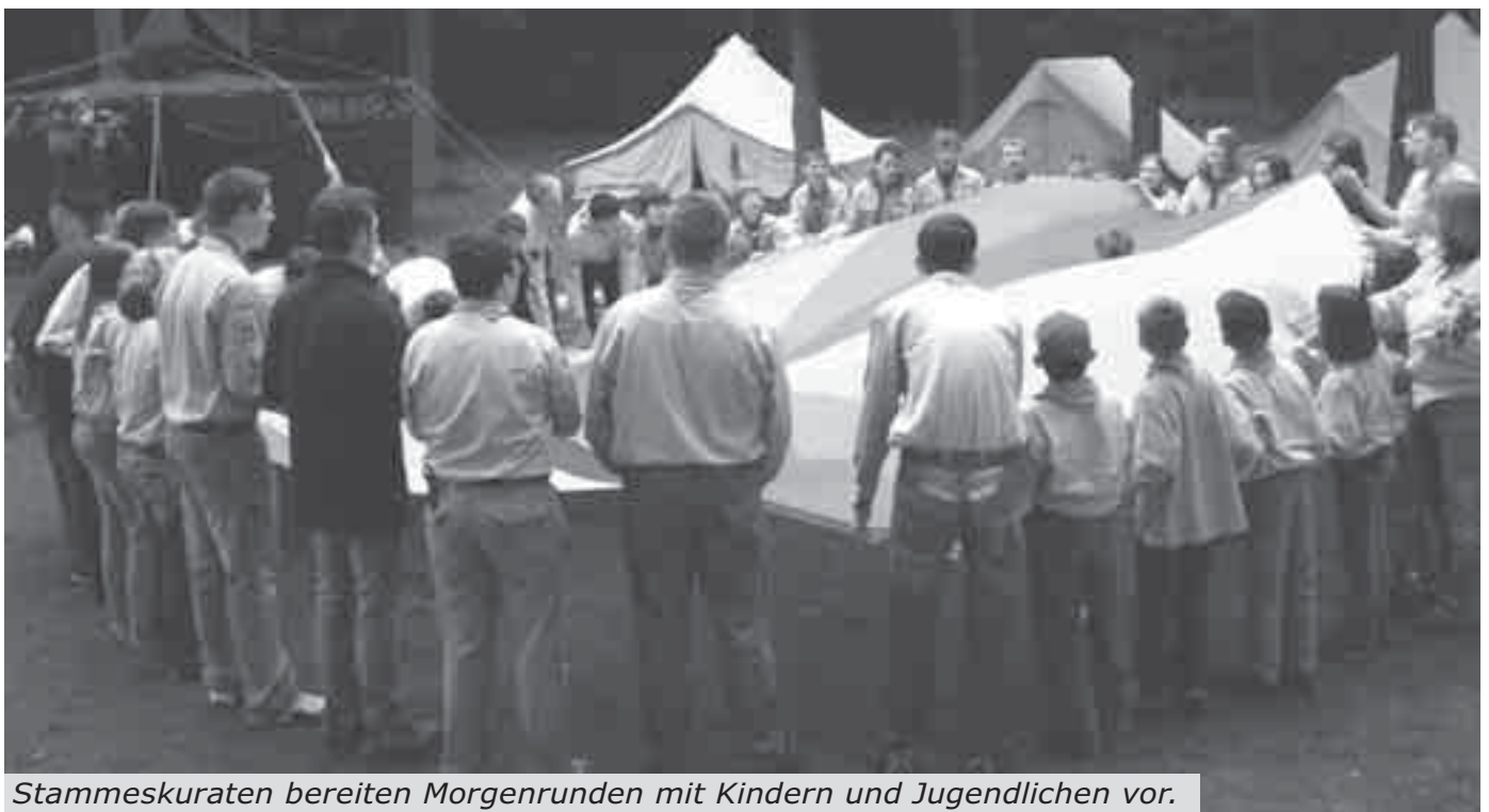
Stammeskuraten bereiten Morgenrunden mit Kindern und Jugendlichen vor.